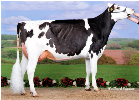
SEEGERS IMPRESSION SUNSHINE