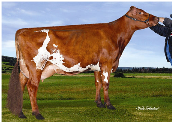
VISSERDALE SELENA 3 GRANDDAM