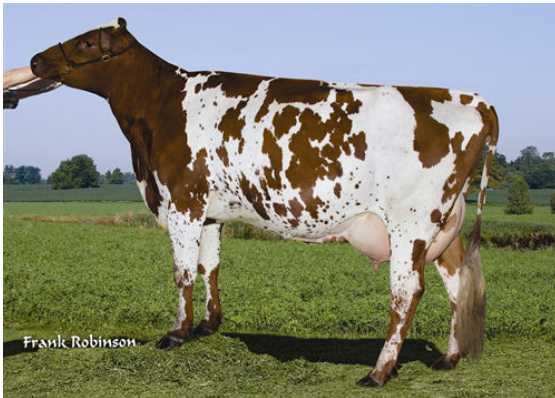
HAUTPRE PETERSLUND MADERA GRANDDAM