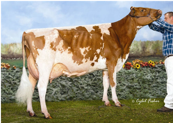
FOREVER SCHOON PING