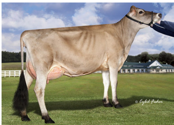
JER-Z-BOYZ MACNCHEZ 48947