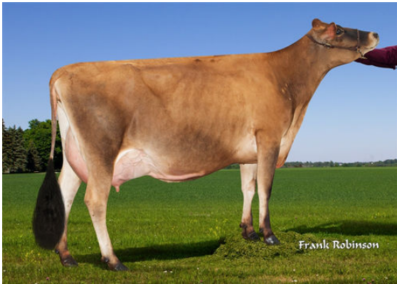
JX PROGENESIS CINDERELLA {6} DAM