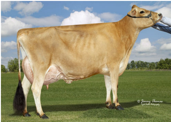
JX OAK LANE EUSEBIO ERICA {5}