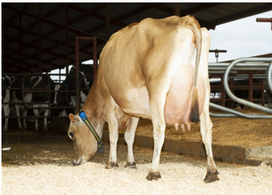
JX OAK LANE EUSEBIO ERICA {5}