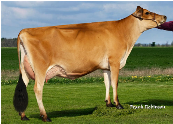
JX VIERRA LADYGAGA {6}