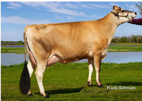
JX FARIA BROTHERS PELE LUBBOCK {4}