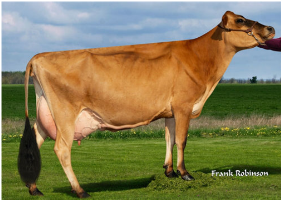
PROGENESIS PELE CLASSY DAUGHTER