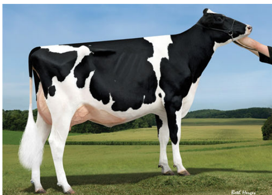
SANDY-VALLEY BL PARADISE