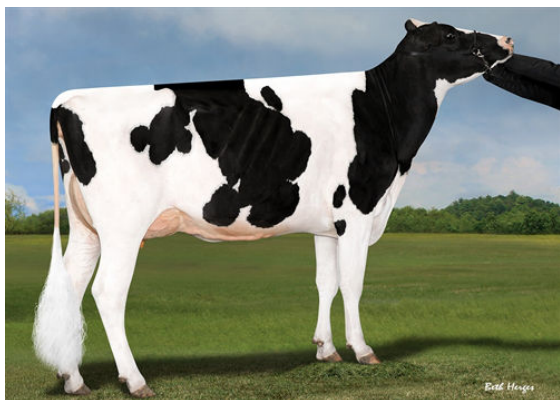
SYNERGY RUBICON PERFECT