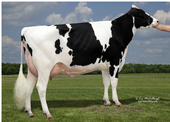
SYNERGY UNO POT O GOLD