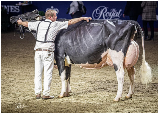
JACOBS HIGH OCTANE BABE DAM