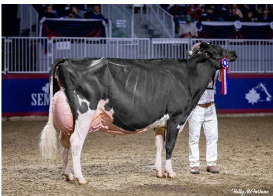
JACOBS HIGH OCTANE BABE DAM