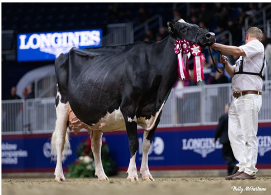
JACOBS HIGH OCTANE BABE DAM