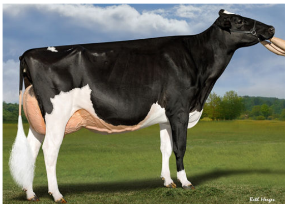
S-S-I DOC HAVE NOT 8784 FULL SISTER TO DAM - SOLD WITH PACKAGE OF PREGNANCIES FOR $1.9M IN JUNE 2022