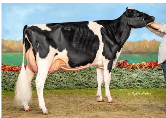
S-S-I DOC HAVE NOT 8783 DAM - NOMINATED ALL-AMERICAN MILKING YEARLING 2019