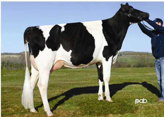
GEN-I-BEQ BOLTON SECRETLY FIFTH DAM