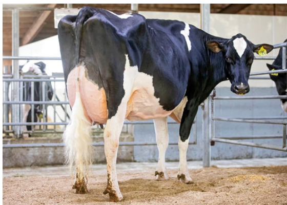
SIEMERS LMDA PARIS 27856