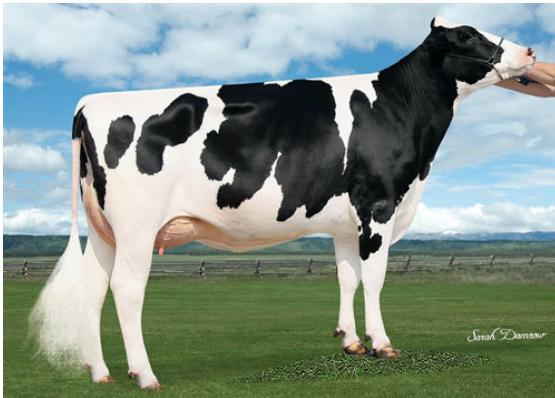
WINSTAR CRIMSON GEM