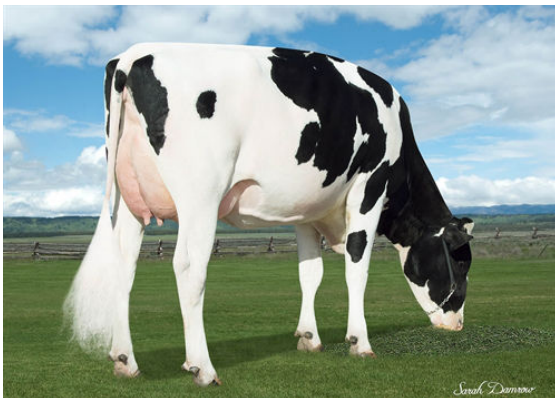
SEAGULL-BAY JEDI MIRAGE