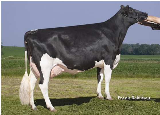
RI-VAL-RE GOLDWYN NADINE