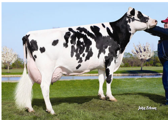
VATLAND O MAN MARY 2007 FIFTH DAM