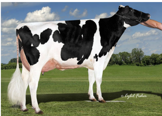
COOKIECUTTER SUPR HAZAJO DAM