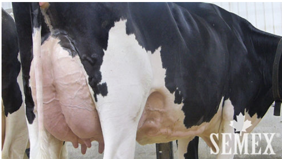
CLAYNOOK DIVINITY UNIX GRANDDAM