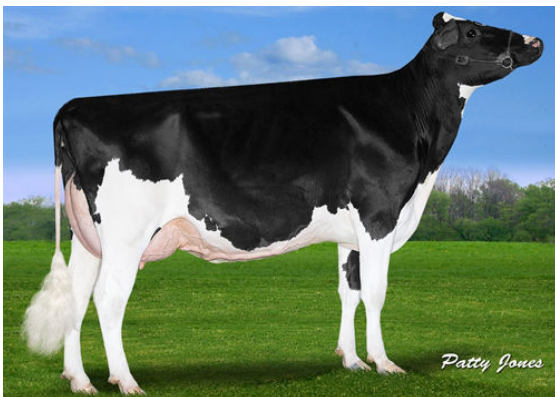
CLAYNOOK DIVINITY UNIX GRANDDAM