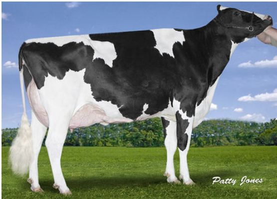
CLAYNOOK DEWDROP MONTEREY DAM