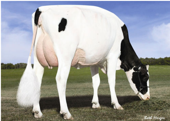
DES-Y-GEN PLANET SILK FOURTH DAM