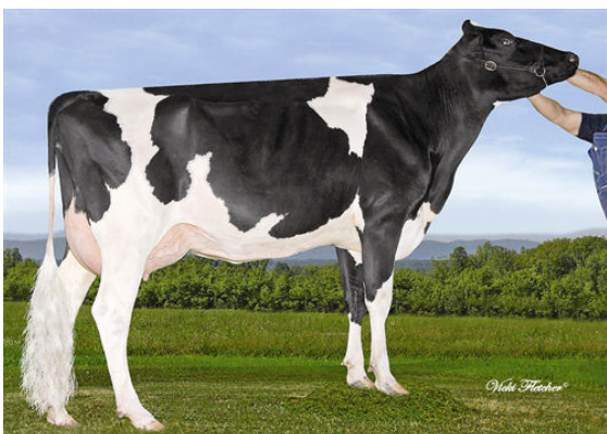
GEN-I-BEQ BOLTON SILENCE-ETS FIFTH DAM