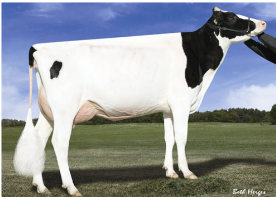
DES-Y-GEN PLANET SILK FOURTH DAM