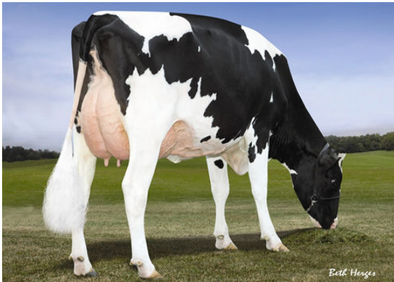
LARCREST CALE FOURTH DAM