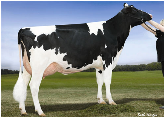
LARCREST CALE FOURTH DAM