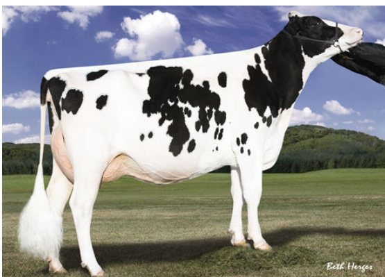
LARCREST CRIMSON FIFTH DAM