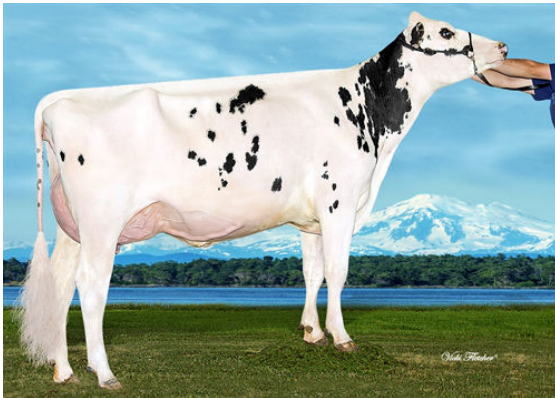
WESTCOAST ABURN BDUST 4061 DAM