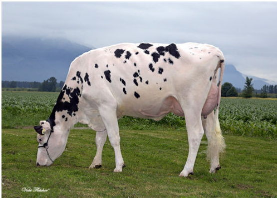
WESTCOAST ABURN BDUST 4061 DAM