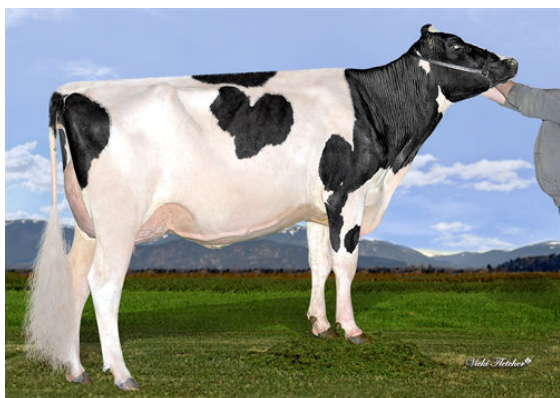
WESTCOAST POPSTR SIL6827 8977 DAUGHTER