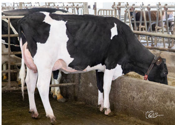
MALTEC ULIE DAUGHTER