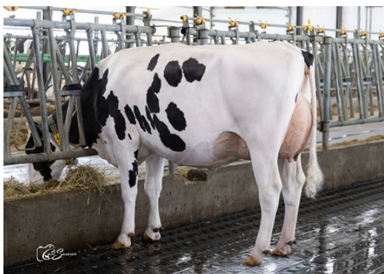
MARIDEL POPSTAR PALY DAUGHTER