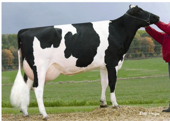
SANDY-VALLEY BOLT SHEILA FOURTH DAM