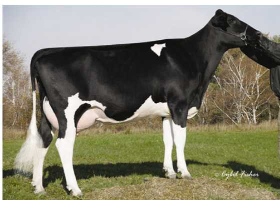
SANDY-VALLEY FORBID SULLY FIFTH DAM