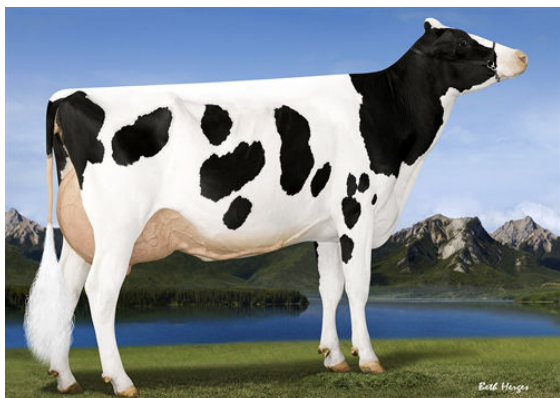
WESTCOAST MONTEREY ALEXAL 289 DAM