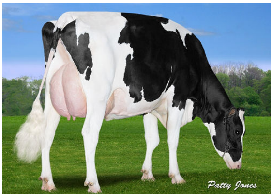
CLAYNOOK REATA WICKHAM