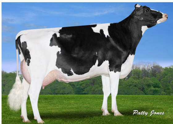
CLAYNOOK REATA WICKHAM