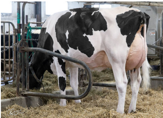
DUSOLEIL ATEAM SCARLETTE