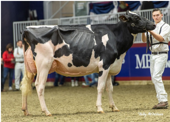
DANDYLAND ATEAM LALA DAUGHTER

SEAGULL-BAY SILVER STANTONS CAMEO APPEARANCE VG-85-2YR-CAN 10* BOLDI V S G ANTON STANTONS SHAMROCK COCO CHANEL EX-90-8YR-CAN 6* LADYS-MANOR PL SHAMROCK STANTONS FREDDIE CAMEO EX-91-3E-CAN 63*