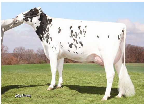
WABASH-WAY EMILYANN THIRD DAM