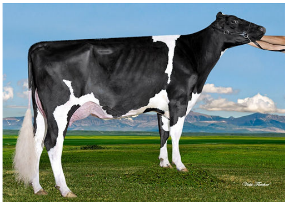
WESTCOAST FORTUNE GOLDIE 5870