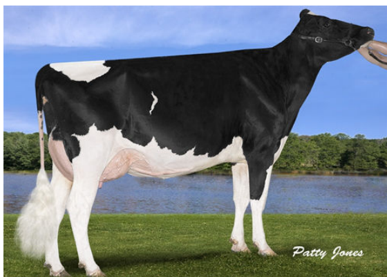
SERENITYHILL NIAGRA ROZ GRANDDAM