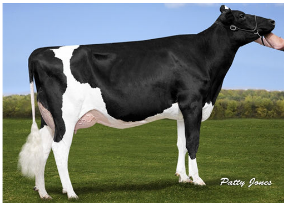
CHERRY CREST THATS NEAT DAM