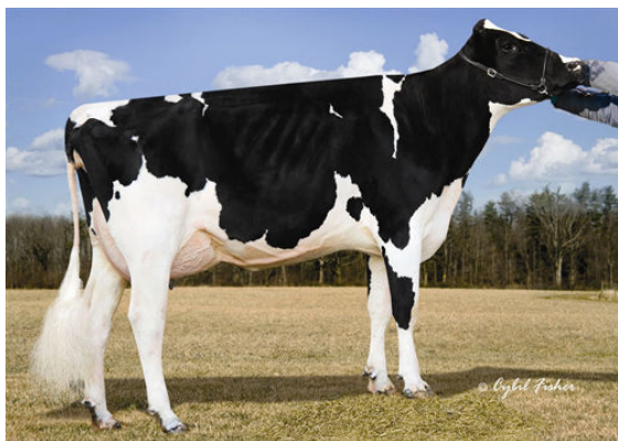
FLY-HIGHER BOLTON MISHA GRANDDAM