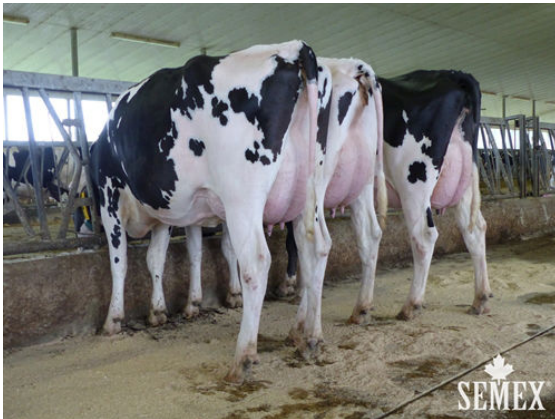
JAZZNIGHT DAUGHTER GROUP

(L to R) ONTOWA COPILOT, ONTOWA PILOT and ONTOWA 949