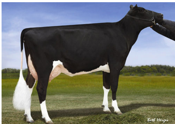
LARCREST CATO DAM