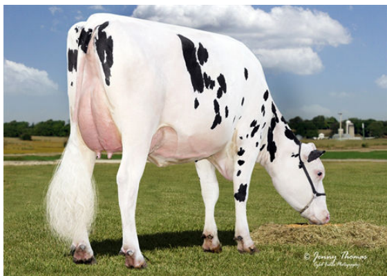
RELIANCE EMERO 7153