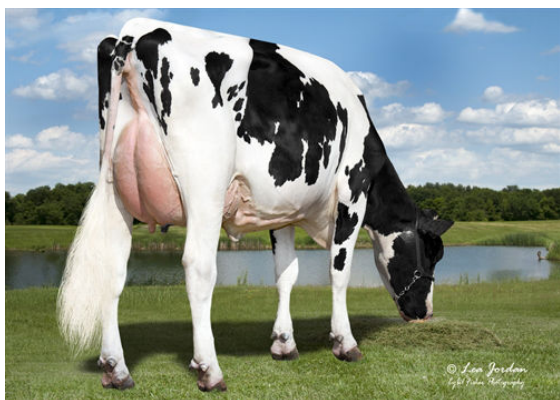
VANDOSKES EMERO 3717