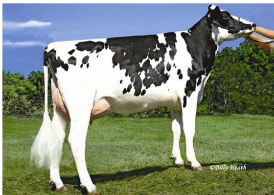
UFM-DUBS SHERAY Granddam