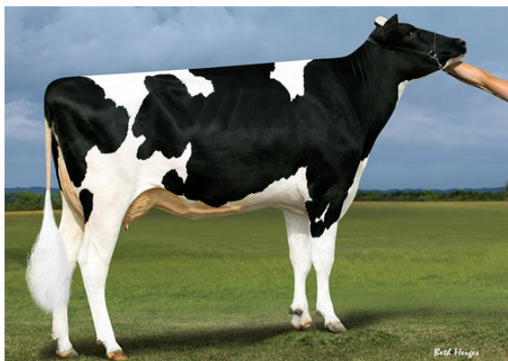
REGANCREST JS BETSIE GRANDDAM