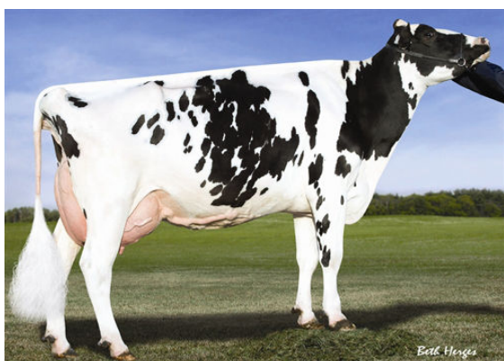
REGANCREST M BENISHA FIFTH DAM