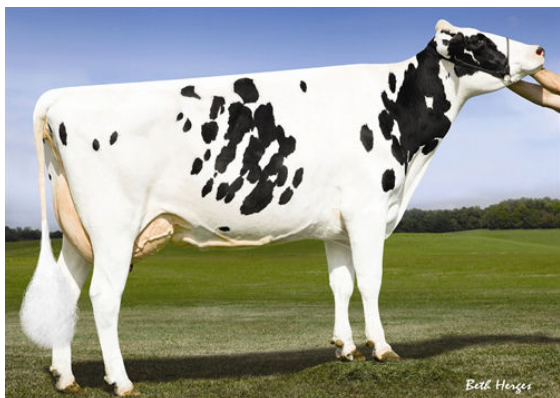
REGANCREST DORCY BENISHEY FOURTH DAM