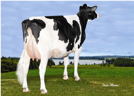
SEAGULL-BAY WNBK SUNDAY DAM