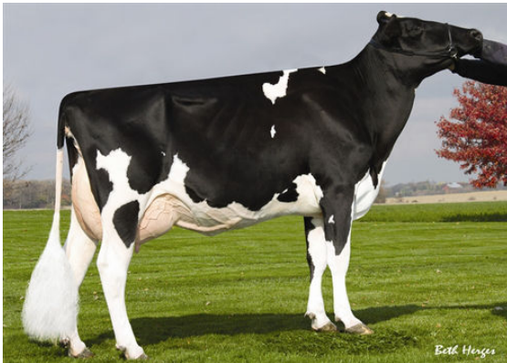
AMMON-PEACHEY SHAUNA GRANDDAM