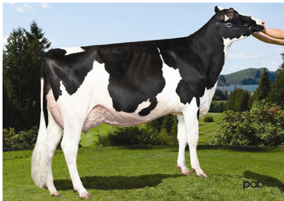
LES091 BAXTER MODEL RUBIS GRANDDAM