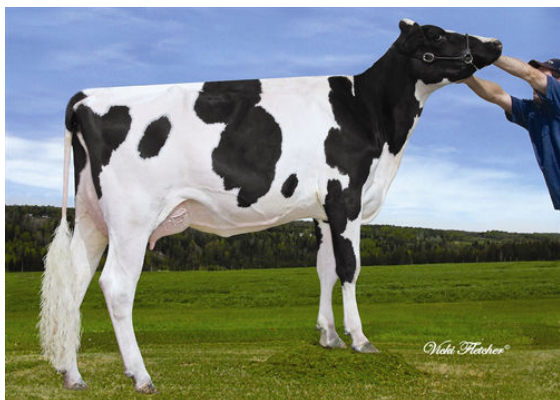
BEAUCOISE BOLTON PRINCESS DAM