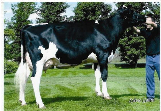
BEAUCOISE INQUIRER CITATION THIRD DAM