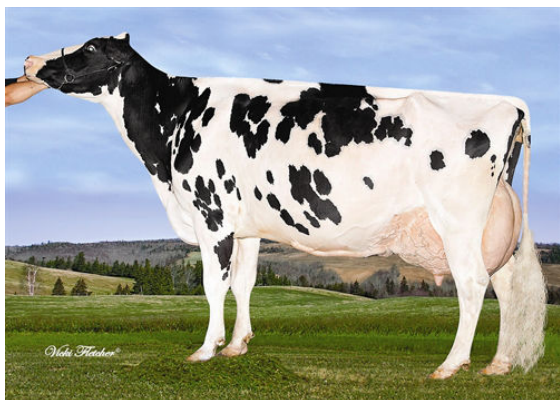
GERANETTE F B I LAURIE GRANDDAM