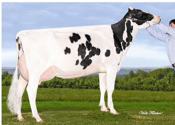
GERANETTE BOLTON LAURE DAM