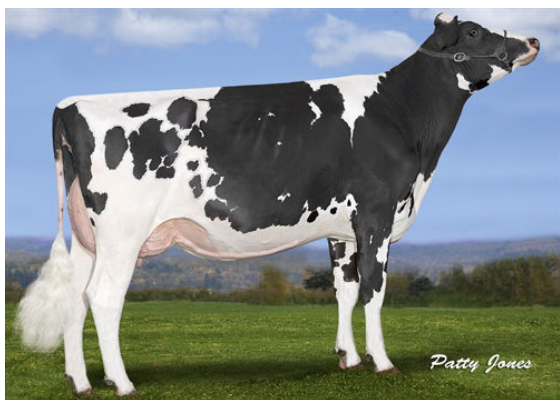
LYBA FIX LILAC