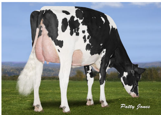
LYBA FIX LILAC