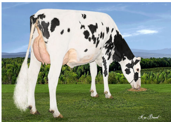
AGRIMATIC FIX IZA 2