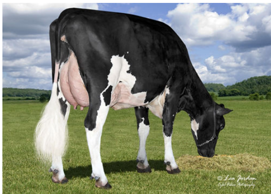
FERTILE RIDGE BELMONT 7951

MORFOLOGIA 48 All. 99 Figlie 89% Att. GMACE 24*DEC