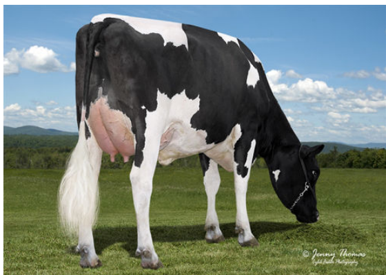
BRIGREEN BELMONT 2525