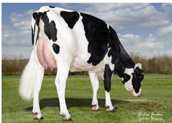
BLASER DIRECTION 5381