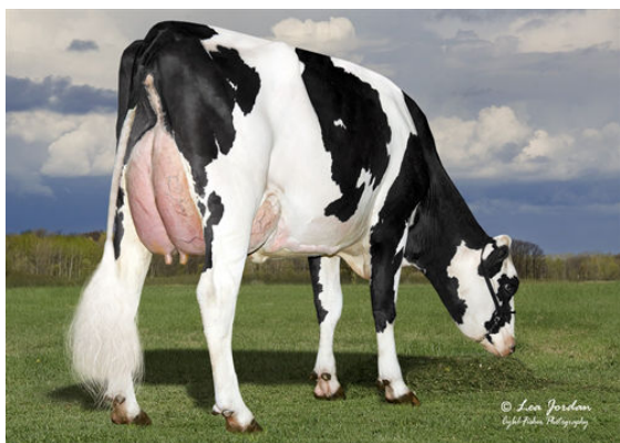
SGD ONE DIRECTION 18076