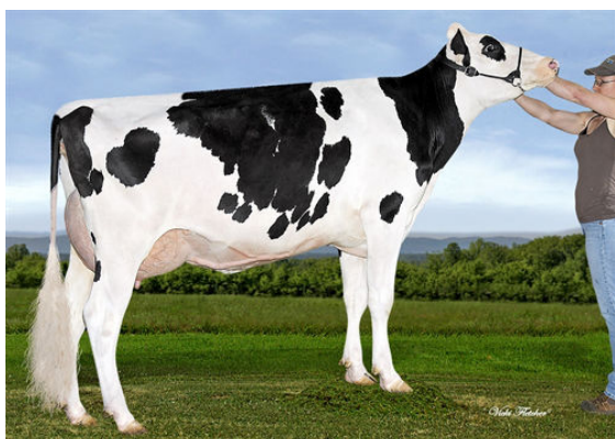
CLERINDA ONE DIRECTION TUNESIE