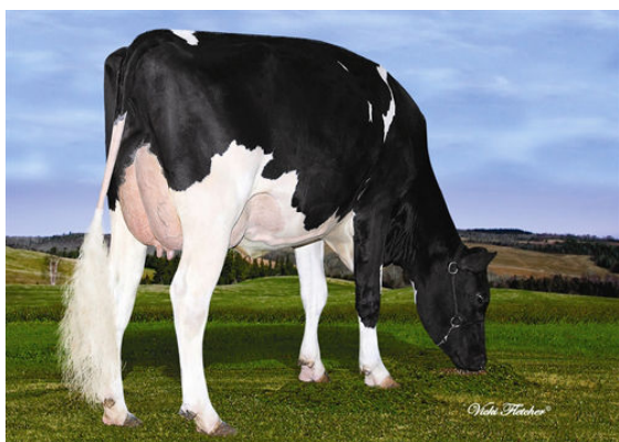
AMIGO BRUNO PRINCESSE