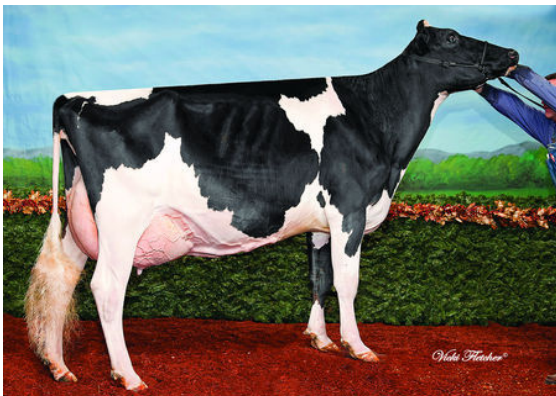
DUALANE WINDBROOK CIERRA

GILLETTE BRILEA F B I GILLETTE BLITZ 2ND WIND VG-88-3YR-CAN 74* FUSTEAD EMORY BLITZ BRAEDALE SECOND CUT VG-86-2YR-CAN 23* MAUGHLIN STORM BRAEDALE GYPSY GRAND VG-88-5YR-CAN 37*