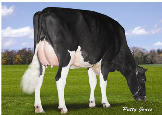
DORAL SENNET CANADA