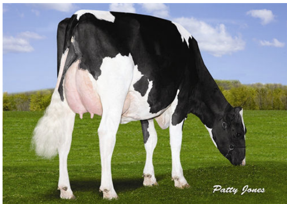
PONDVUE SENNET SUSAN