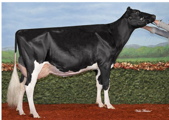
MAPLEBROUGH SENNET RONA