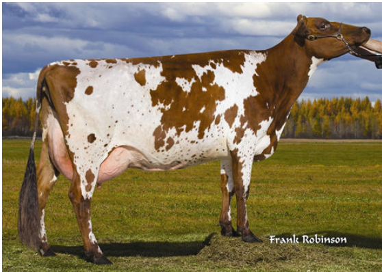
DUO STAR AMOUR FOURTH DAM