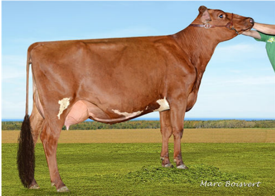
DUO STAR AMITIE THIRD DAM