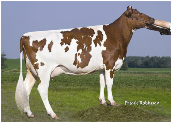
FAUCHER PETER LULABY FOURTH DAM