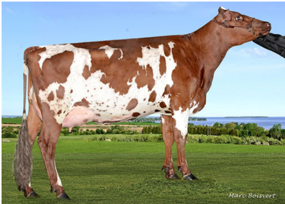
DUO STAR ARMADA DAM