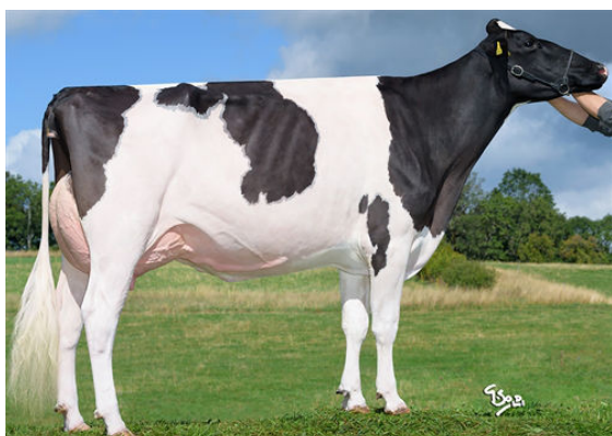
PTIT COEUR SIDEKICK DANCING